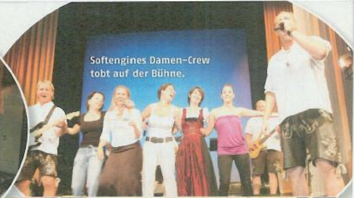
Softengine Damen-Crew tobt auf der Bühne.