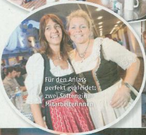
Für den Anlass perfekt gekleidet: zwei Softengine-Mitarbeiterinnen