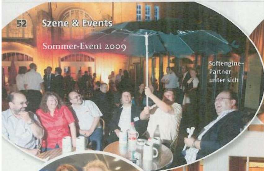
Softengine-Partner unter sich