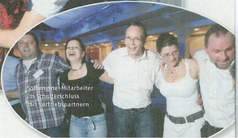
Softengine-Mitarbeiter im Schulterschluß mit Vertriebspartnern