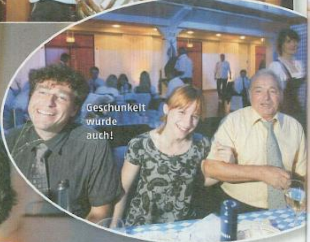
Geschunkelt wurde auch!

Das Oktoberfest in München ist derzeit noch im Gange, in der Pfalz dagegen wurde schon Ende August die Wiesn gefeiert. Zum Abschluss des Softengine-Sommer-Events 2009 hatte der Hersteller die anwesenden Vertriebspartner zur Abendveranstaltung geladen, die im zünftig-bayrisch geschmückten Festsaal mit dazu passend gekleideten Mitarbeitern stattfand. Immerhin gehörte Landau von 1816 bis 1947 zu Bayern. Dr. Ronald Wiltscheck